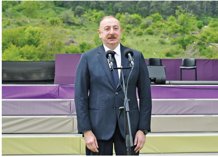
əvvəlki səh. 1-də

Dövlətimizin başçısı diqqətə çatdırıb ki, builki "Xarıbülbül" festivalı Şuşanın "İslam dünyasının mədəniyyət paytaxtı" elan olunmasına həsr edilib: "Bu gün bir çox müsəlman ölkələrinin kollektivləri bizim üçün müqəddəs olan Cıdır düzündə öz məharətlərini ifadə edəcəklər. Bu, birlik bayramı olacaq, bu, həmrəylik bayramı olacaq. Eyni zamanda, Azərbaycan xalqının əyləmə ruhunu nümayiş etdirən bu məkan həm işğala qədər, həm işğal dövründə, həm də işğala son qoyulandan sonra hər birimiz üçün doğma və əzizdir. Bizim qəhrəman əsgər-zabitlərimiz, bax, bu sıldırım qayalara dirmaşaraq yüngül silahlarla şəhəri düşməndən azad etmişlər.